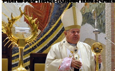
Przewodniczący komisji ds. kandydatury do episkopatu polskiego kardynał Józef Komorowski, biskup diecezji wrocławskiej