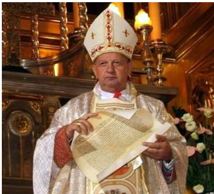
Przewodniczący komisji ds. kandydatury do episkopatu polskiego kardynał Józef Komorowski, biskup diecezji wrocławskiej